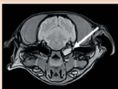
Transversaler Gradient Echo T2-gewichteter Scan mit gelartigem Flüssigkeitspfropf in der linken Mittelohrhöhle (Pfeil).