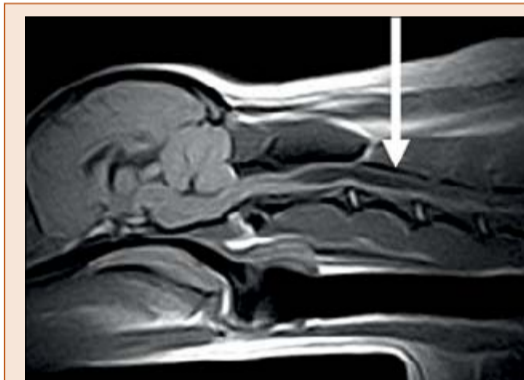
Sagittaler T1-gewichteter Scan mit deutlicher Erweiterung des Zentralkanals des zervikalen Rückenmarks (Pfeil).